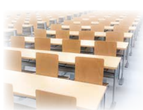
◀特別講演・ シンポジウムの様子