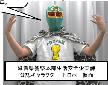
滋賀県警察本部生活安全企画課 公認キャラクター ドロボー仮面