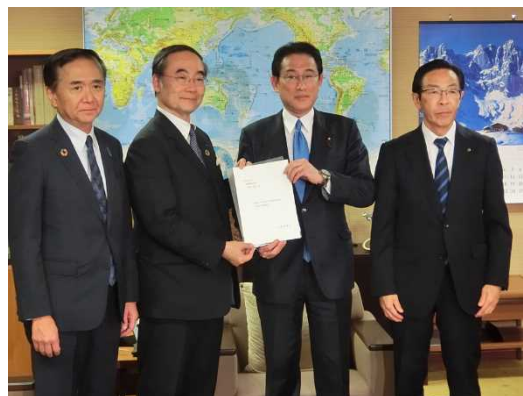
全国知事会会長 徳島県知事 飯泉嘉門

引き続き、国と共に責任を共有する「より一層行動する知事会」として、アンテナ高く、刻々と変化する事態を踏まえ、国としっかりと連携し、国民の皆様の安全・安心の確保に万全を期して参ります。