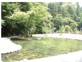
滋賀県醒井養鱒場