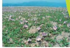
ハマヒルガオ