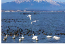
琵琶湖の水鳥