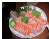
ビワマスの姿づくり

びわ湖の恵みをいただくことは、びわ湖を知ること、びわ湖を大切にすることにつながります。びわ湖の恵みに感謝して、新鮮でおいしい料理を食べてみよう。