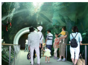
滋賀県立琵琶湖博物館

しがけんりつびわこ 滋賀県立琵琶湖博物館 草津市下物町 1091 TEL 077-568-4811 http://www.lbm.go.jp/