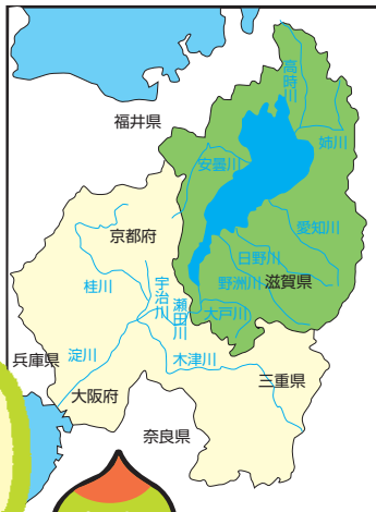
びわ湖・淀川の 水の流れ

そして、びわ湖にたくわえられた水は瀬田川や淀川として下流の京都や大阪を流れ、下流の人たちの生活を支えながら大阪湾に流れ込みます。