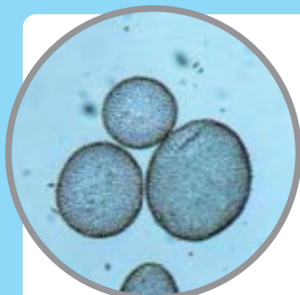
あかしお 赤潮の原因となるプランクトン (ウログレナ・アメリカーナ)

びわ湖は昔から、多くの人々の生活を支えてきました。 私たちの暮らしに必要な水や魚などを提供してくれる、 なくてはならない存在です。