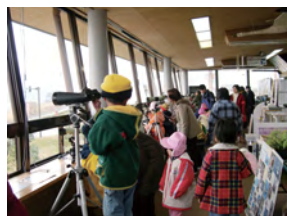
湖北野鳥センター／琵琶湖水鳥・湿地センター