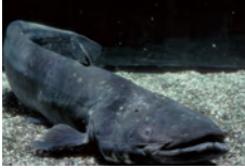
ビワコオオナマズ