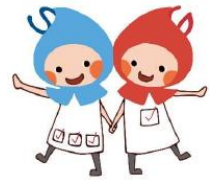
滋賀県健康づくりキャラクター しがのハグ&グミ