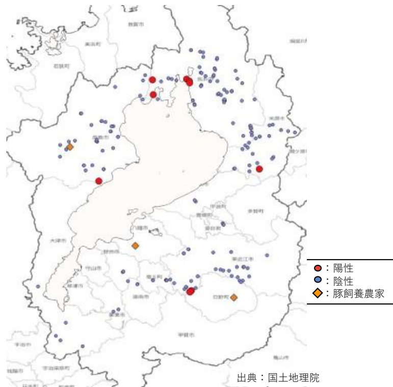
図1 PCV 2 の陽性分布