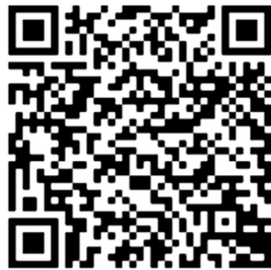
（クレジットカード）

https://ttzk.graffer.jp/pref-shiga/smart-apply/apply-procedure/8451560231614104907