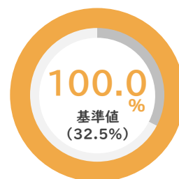
女性正規従業員比率

建設業に携わる職場において長年培われた技術力を大切に、女性が「私らしい働き方で勤続、活躍できる」環境づくりに努めています。