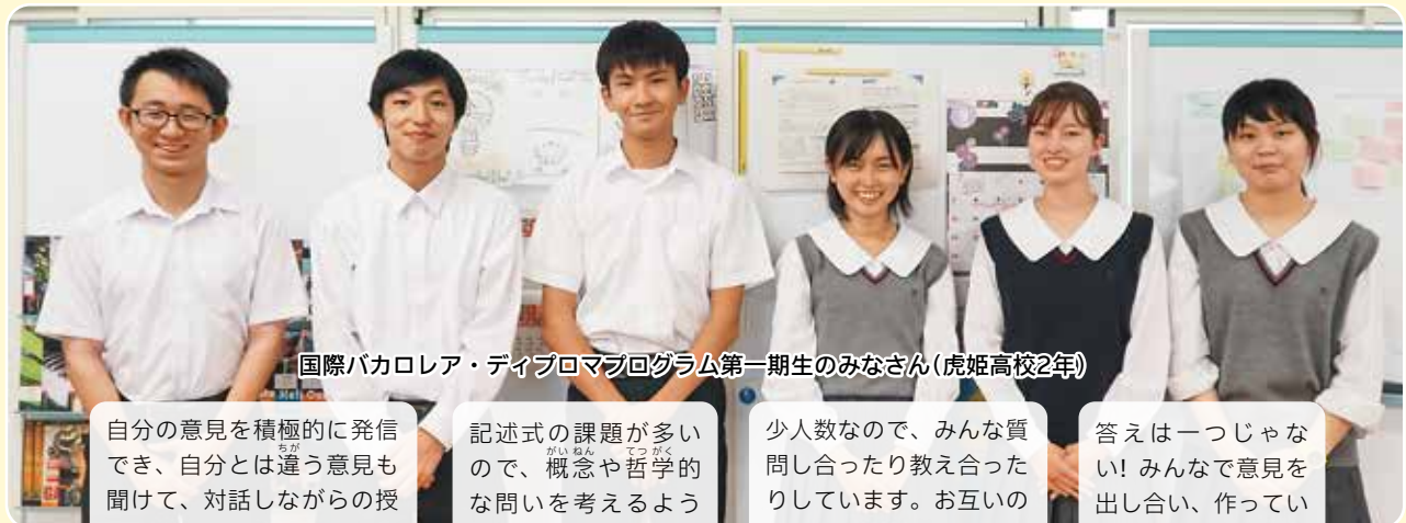
国際バカロレア・ディプロマプログラム第一期生のみなさん(虎姫高校2年)

自分の意見を積極的に発信でき、自分とは違う意見も聞けて、対話しながらの授業が楽しいです。