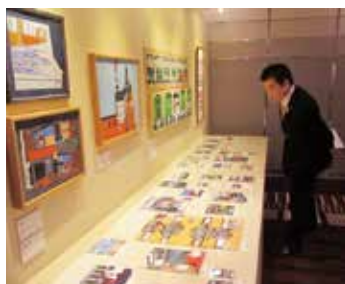
アールブリュットの作品展にて

県広報誌「滋賀プラスワン」は、点字版・音声版でも配布しています。音声版の「みんなでプラスワン!」のコーナーは三日月知事の朗読によりお聞きいただけます。