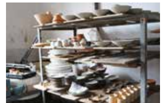
ドラマ用に準備された陶器

お問合せ 信楽窯業技術試験場 TEL 0748-82-1155 FAX 0748-82-1156 e fd3101@pref.shiga.lg.jp