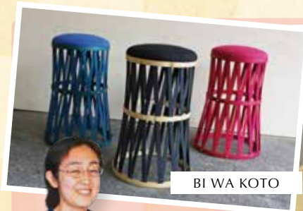
BI WA KOTO

「滋賀県伝統的工芸品指定要綱」に基づく知事の指定を受けた工芸品であることを示す。