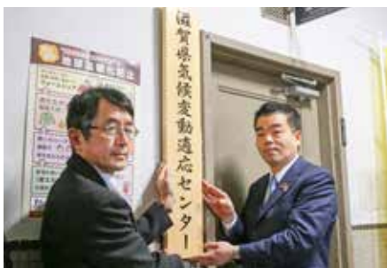
気候変動適応センターの看板を設置

昨夏は特に暑い日が続きました。今年も5月から全国各地で真夏日が観測されるなど、地球温暖化が原因と思われる異常気象が懸念されます。県では、気候変動適応法に基づき、「滋賀県気候変動適応センター」を、今年1月に設置しました。気温や自然災害、生態系や農林水産業、そして健康など、あらゆる面で気候変動の影響に適応していくための知恵や技術を集めています。 琵琶湖は？ 冬の雪は？ 雨は？ 虫は？ 草木は？ アユは？ 身近な暮らしの中で、日々、「変化」は起こっています。 地球全体のこと、未来のことを考えた、私たちの「今」の行動も大切にしていきましょう!