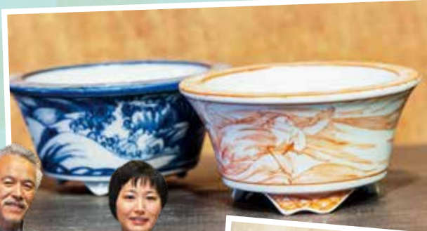
BI WA KOTO

伝統の技術で今の生活に合うアイテムを創り出してこそ、伝統を次の世代へ引き継いでいけると思います。