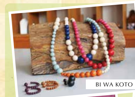
BI WA KOTO