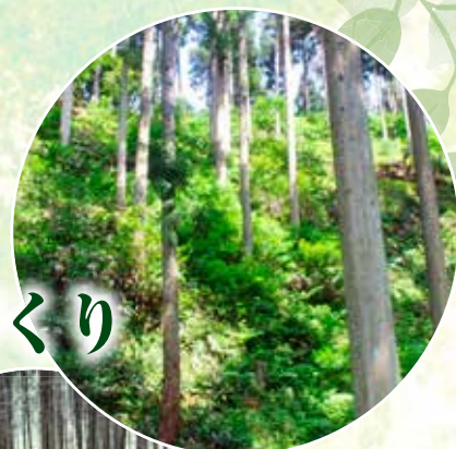
▲手入れされた森林

また「びわ湖水源のもりづくり月間(10月)」には年間7,000人以上が森林を守り、育てる活動に関わっています。