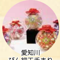
愛知川びん細工手まり