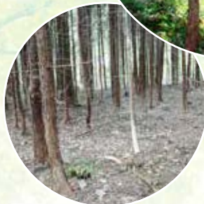
◀手入れされていない森林