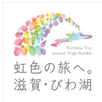
[ カラーバージョン ]