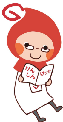
滋賀県健康づくりキャラクター しがのクミ

パートナーが1人だから『大丈夫!』ではありません。 パートナーの元パートナーのことを知っていますか? その元パートナーの元パートナーのことは??... 保健所では性感染症の検査を実施しています。