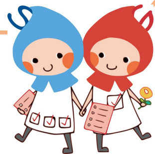
滋賀県健康づくりキャラクター しがのハグ&クミ

【予約・問い合わせ先】 甲賀保健所 健康危機管理係 TEL 0748-63-6147 FAX 0748-63-6142