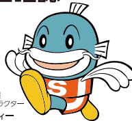
滋賀県 イメージキャラクター キャプフィー