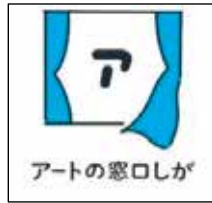
ぶんかげいじゆつ かつどう そうだん 文化芸術の 活動を 相談できる ところ