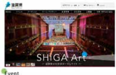
Event ホームページで 文化芸術の イベントを 紹介