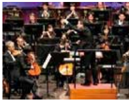
ほーる こ じぎょう ようす 「ホールの子」事業の 様子