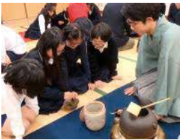
ちゃ たいけん ようす お茶を たてる 体験の 様子