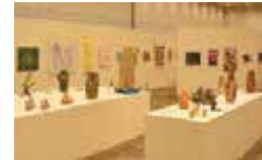
ぴかっto アート展の 様子