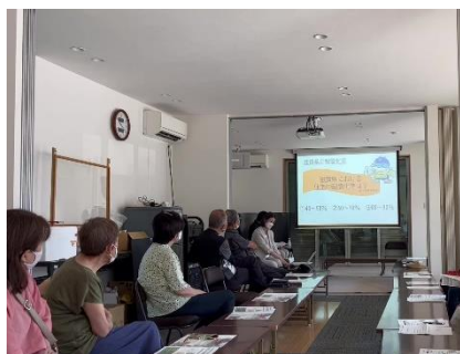
自治会での出前講座