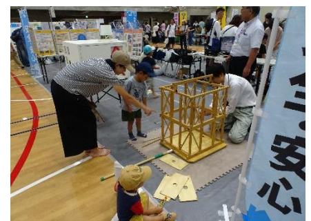
啓発イベントにおけるブース出展