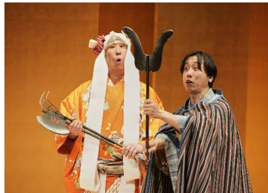
過去公演 おうみ狂言図鑑「七道具」より