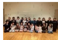
高島少年少女合唱団