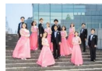
びわ湖ホール声楽アンサンブル