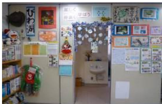
教室の中の掲示板 ~作品も見てね~