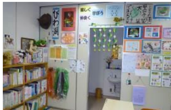
図書の貸し出しもしています