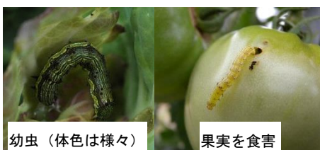
写真 ミニトマトの果実を加害するタバコガ類幼虫

お問い合わせ先：滋賀県病害虫防除所 TEL:0748-46-4926 FAX:0748-46-5559 Email:gc70@pref.shiga.lg.jp http://www.pref.shiga.lg.jp/boujyo/