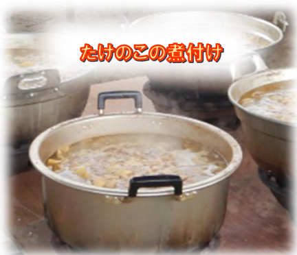
たけのこの汁付け

※車でのご来場が可能ですが、葉枝見橋北詰めの交差点等、交通安全に十分ご注意ください。