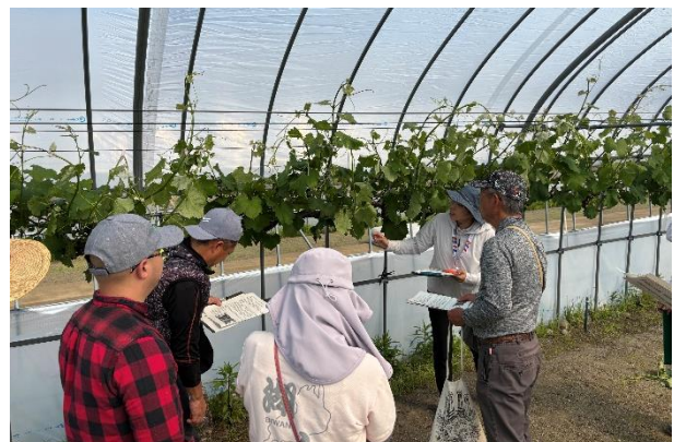
講義・実習(左:1回目「芽かき」、右:2回目「枝管理・房づくり」)