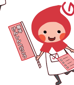
08けんしんへ行こう