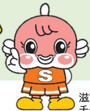
滋賀県イメージキャラクター チャップフィー