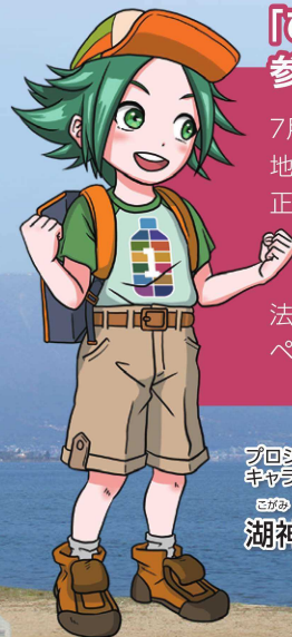
プロジェクト キャラクター こがみ せいのいち 湖神挑一