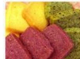
【16】ベジタブルミックス