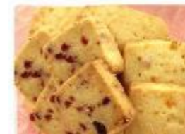
【14】フルーツミックス

チョコチップ・ココア・プレーンのミックスクッキー。彦華堂の人気No.1 商品です！