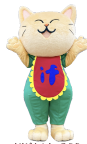
オリジナルキャラクター ifにゃん

夢工房ifでは認定NPO法人サタデーピアが設置・運営している障害福祉サービス事業所です。 手作りクレープやランチ等が人気のカフェ、こぎん刺しやブローチ等の工芸製品の製作・ 焼き菓子を作る工房があります。 自立や一般就労に向けてよりよいステップになるよう請負作業にも取り組んでいます。