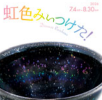
重要文化財 耀変天目(部分) 中国・南宋時代

雨上がりの空にかかる美しい虹を見つけ、思わず声をあげそうになったことはないですか。虹も虹を思わせるような輝きも、不思議と私たちの心を捉えます。虹色光彩が際立つ当館の耀変天目をはじめ、貝殻の虹色を活かした螺鈿漆器や古代に作られ自然の力で虹色になった銀化ガラスの数々を中心に展覧いたします。どなた様も、無垢な心で様々な虹色とふれあい、光が色となって現れる妙を感じていただければ幸いです。