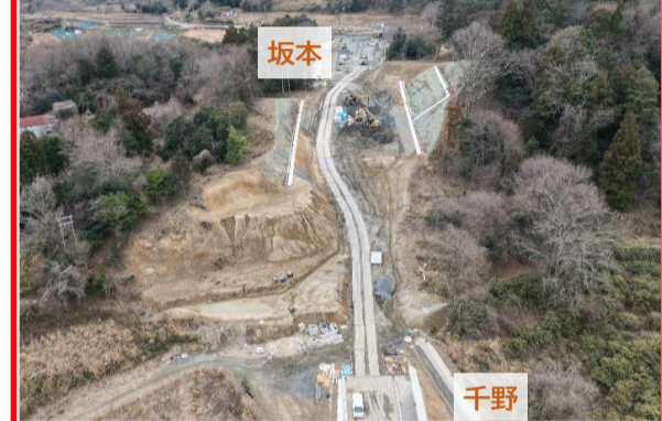
②伊香立浜大津線 道路整備事業（坂本）