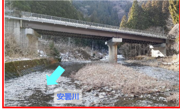
②伊香立浜大津線 道路整備事業（千野）