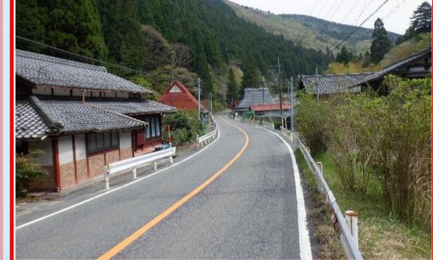
⑥真野川 河川改修事業（真野）