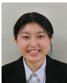
第18期卒塾生 小学校教諭

振り返ると、『滋賀の教師塾』での経験が今の自分に確実に繋がっていると感じています。特に印象に残っているのは、実際に小学校へ足を運ぶ実地体験です。今の子どもたちの学びの姿や先生方の授業の仕方を肌で感じる事ができました。また、講義では様々な実践事例を学ぶことができ、「授業をつくる」ということへの理解が深まりました。