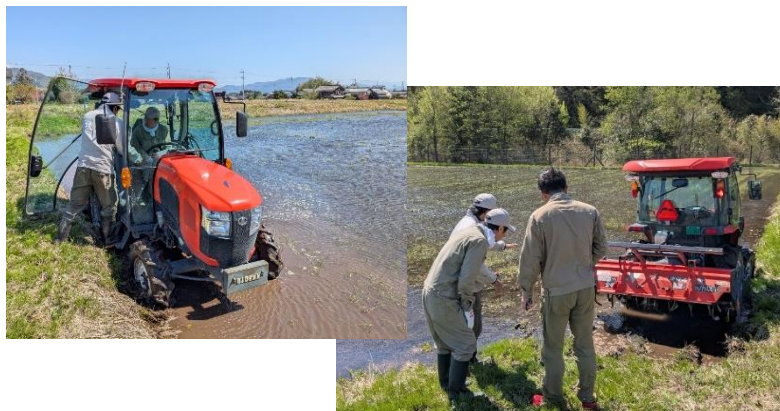
図2.現地ほ場でのトラクター操作研修