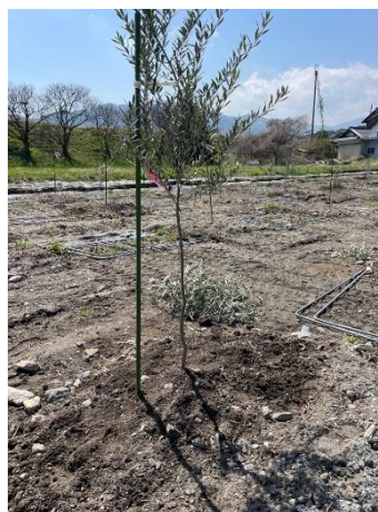
オリーブ苗木の植栽支援