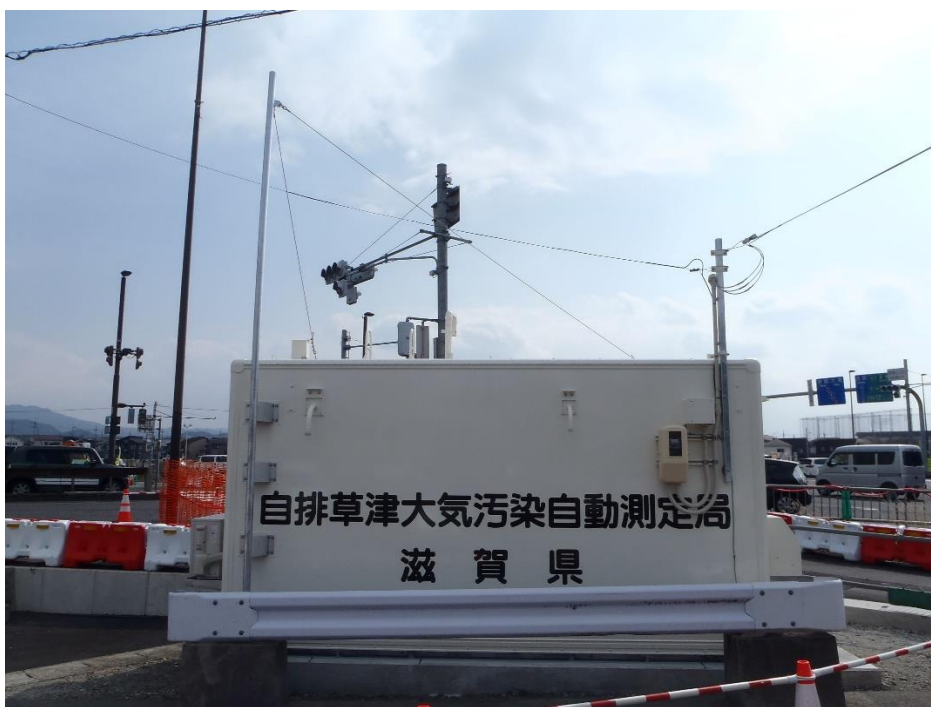
図2. コンテナ局舎の外観例（現自排草津局）兼コンテナ外壁面の表示例