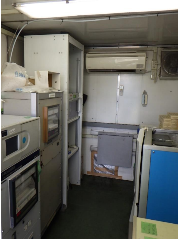
図3. コンテナ局舎の内観例