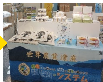
【県内百貨店での販売】