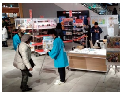
「魚のゆりかご水田米」PR活動

「魚のゆりかご水田米」のブランド力向上を目的に、統一パッケージデザインの利用促進や首都圏でのPR活動等を実施しています。