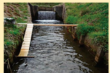
水路からの脱出施設