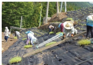
景観作物の作付け