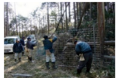
獣害防止柵の補修