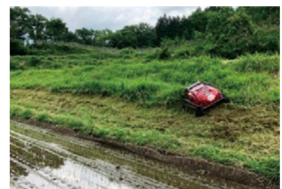
リモコン式自走草刈り機の導入