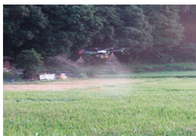
ドローンによる防除作業