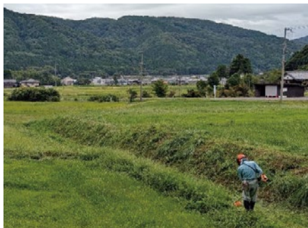
ボランティアによる草刈り作業

棚田保全活動に賛同いただける企業や個人の皆さんから直接棚田地区への寄附を募る制度の広報を支援しています。