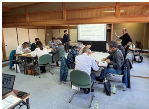
リーダー育成事業で開催した研修

行政職員を対象に、地域づくりを進めるための知識、ノウハウを学ぶための研修会を実施し、行政職員のスキルアップを図ります。