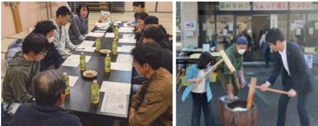
将来ビジョンの策定に向けた話し合い（東草野地区）