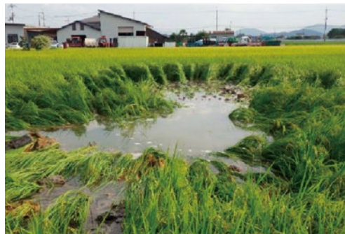
圧送管の破損による被害

※4：リスク管理…さまざまな危険を、最少の費用で最小限に抑えようとする管理手法。危機管理