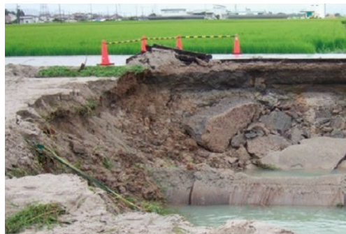
管水路の破損による農道の陥没

特に、滋賀県には、琵琶湖からポンプで揚水する施設が多く、漏水や施設損傷など事故が発生すれば、農業生産だけでなく、地域の生活にも多大な影響を及ぼすことが懸念されることから、施設のリスク管理 ※4 が求められています。