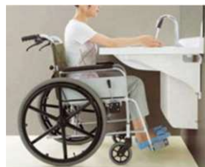
〈対応洗面所への改修工事〉