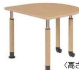
〈高さ可動式テーブル〉