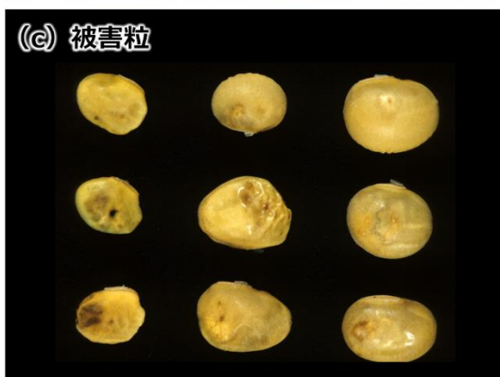
写真 ミナミアオカメムシ