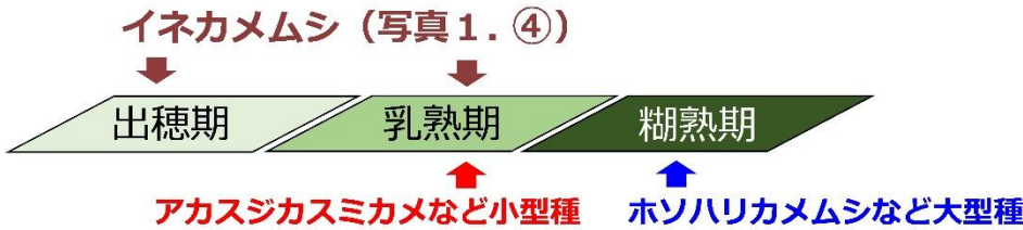
図2 斑点米カメムシ類の防除時期