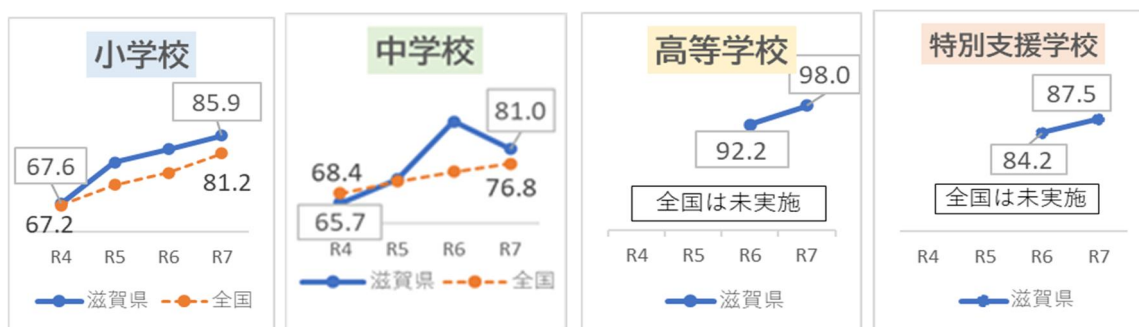
【指標①】前年度にICT機器を活用した授業を1クラスあたりほぼ毎日行った割合

・これまでの推進計画の指標①「前年度にICT機器を活用した授業を1クラスあたりほぼ毎日行った割合（令和7年度の全国学力・学習状況調査）」という質問に対して、県内学校の全ての校種で8割以上の学校がほぼ毎日ICT機器を活用していると回答しており、ICT活用した学習活動が着実に進展し、児童生徒の情報活用能力の育成が図られているところです。