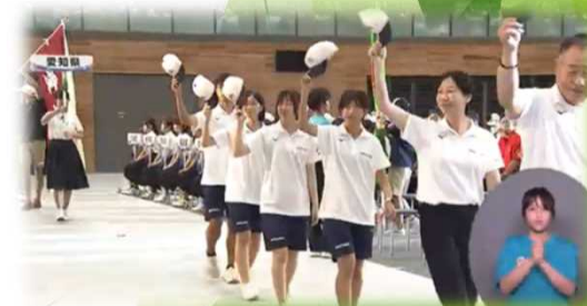
（参考）R6.7.24に開催された開会式の様子