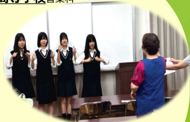
手話研修会の様子