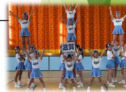
滋賀学園高校 チアリーディング部