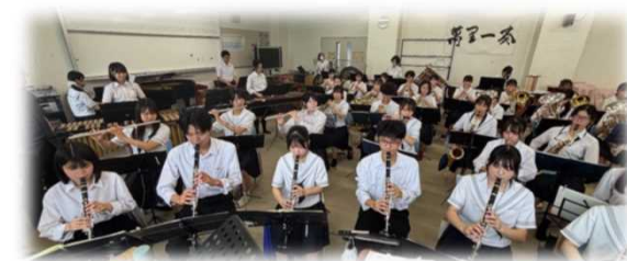
膳所高校吹奏楽班