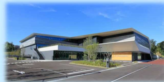
ダイハツアリーナ