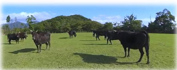
牛たちはストレスなく健やかに

牛を健全に肥育するための、豊富な稲わらをはじめとした飼料と、気候条件に恵まれた土地柄。素晴らしい環境で手間ひまかけられ、牛たちはストレスなく健やかに育てられています。