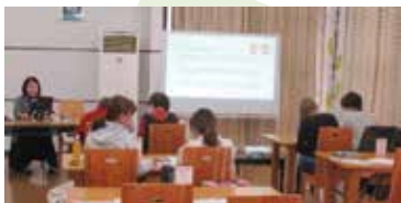
起業支援 セミナーの様子

幅広くたくさんの方に来てもらえるように、女性のチャレンジ起業支援セミナーでは、「平日開催コース」と「土曜開催コース」、デジタルスキルの習得や法律・経営等起業に役立つスキルの学び直しができる「リスクリングコース」を企画しました。