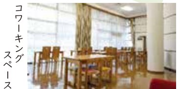
コワーキング スペース

当センター内に設置の女性の起業支援センターでは、WiFi環境のあるコワーキングスペースや起業相談、チャレンジショップ体験の場の提供など、様々な角度から女性の起業を応援しています。オンラインによる起業相談も実施しています。