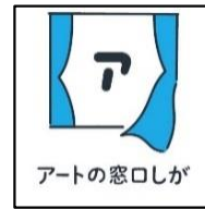
あーと 「アートの まどぐち 窓口しが」の ろごまーく ログマーク