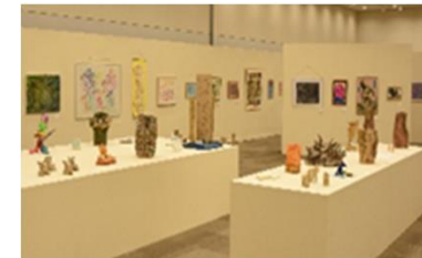
と ぴかっto あーとてん アート展の ようす 様子