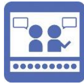
じまく 字幕が あ あります。