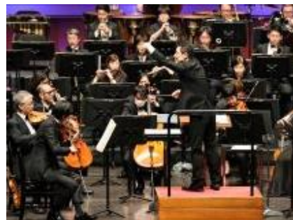
ほーる こ じぎょう ようす 「ホールの子」事業の 様子