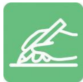
うけつけ 受付で ひつだん 筆談します。