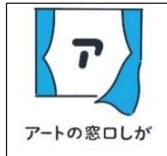
ぶんかげいじゆつ かつどう そうだん 文化芸術の 活動を 相談できる ところ