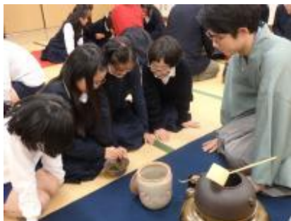
ちゃ たいけん ようす お茶を たてる 体験の 様子