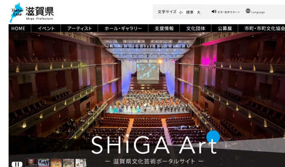
Event [イベント] ほーむぺーじ ぶんかげいじゆつ いべんと しょうかい ホームページで 文化芸術の イベントを 紹介