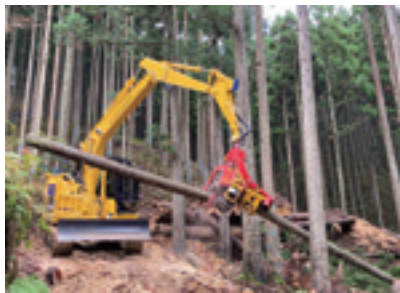
効率的な木材生産