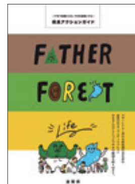
～やまで健康になる、やまを健康にする～ 県民アクションガイド

森林の整備や木材生産を推進するとともに、地域資源の活用に取り組む団体への支援や、企業等が森林と関わる新たな仕組みづくりを行うことで、都市と「やま」をつなぎ、人や経済の循環を創出することで農山村活性化を推進します。