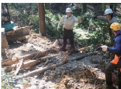
「滋賀もりづくりアカデミー」 既就業者コースの様子

あらゆる世代への森林環境学習や木育を推進することにより、森林づくりへの理解を促進します。また森林整備の重要性などを普及啓発することにより、森林所有者への意欲の喚起に取り組みます。