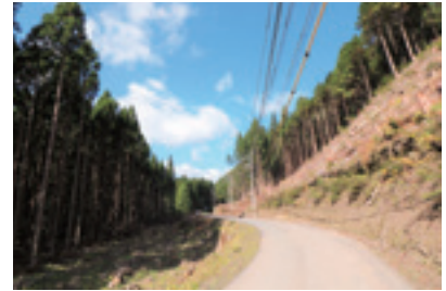
風倒木等被害の対策（予防伐採）

山地災害の復旧や着実な治山施設の整備により災害の未然防止に努めるとともに、ライフライン沿いにおける危険木除去等の減災に資する森林整備等を推進します。また水源林の巡視や土地利用の監視などにより適切な管理を推進します。