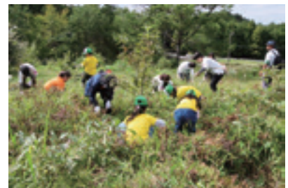
企業と協働による育樹活動の様子

さらに、令和4年に本県で開催された第72回全国植樹祭を契機とし、県民が一丸となって森林を「守る」「活かす」「支える」取組を進めます。