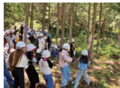
森林環境学習「やまのこ」事業