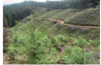
若く生育旺盛な森林（再造林後）

多面的機能を重視した森林づくり、主伐・再造林の促進等による持続可能な森林づくりや花粉発生源への対策、市町と連携した森林経営管理制度の推進を図ります。また計画的な除間伐等による森林吸収源対策の促進等、地球温暖化防止に貢献する森林づくりを推進します。