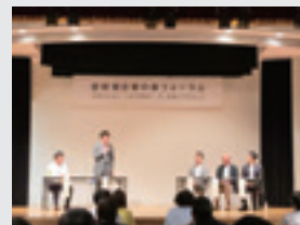
高島市と共催したキックオフイベント 「琵琶湖企業の森フォーラム」