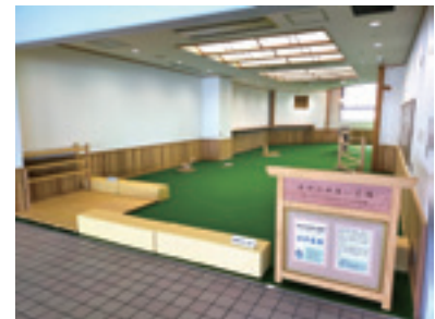
びわ湖材を使用した施設 (びわこポートレース木のふれあい広場)