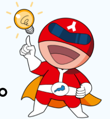
滋賀県人権啓発キャラクター ジアンケンダー