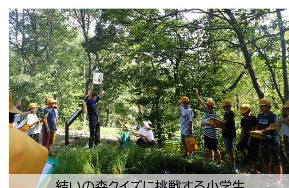
結いの森クイズに挑戦する小学生