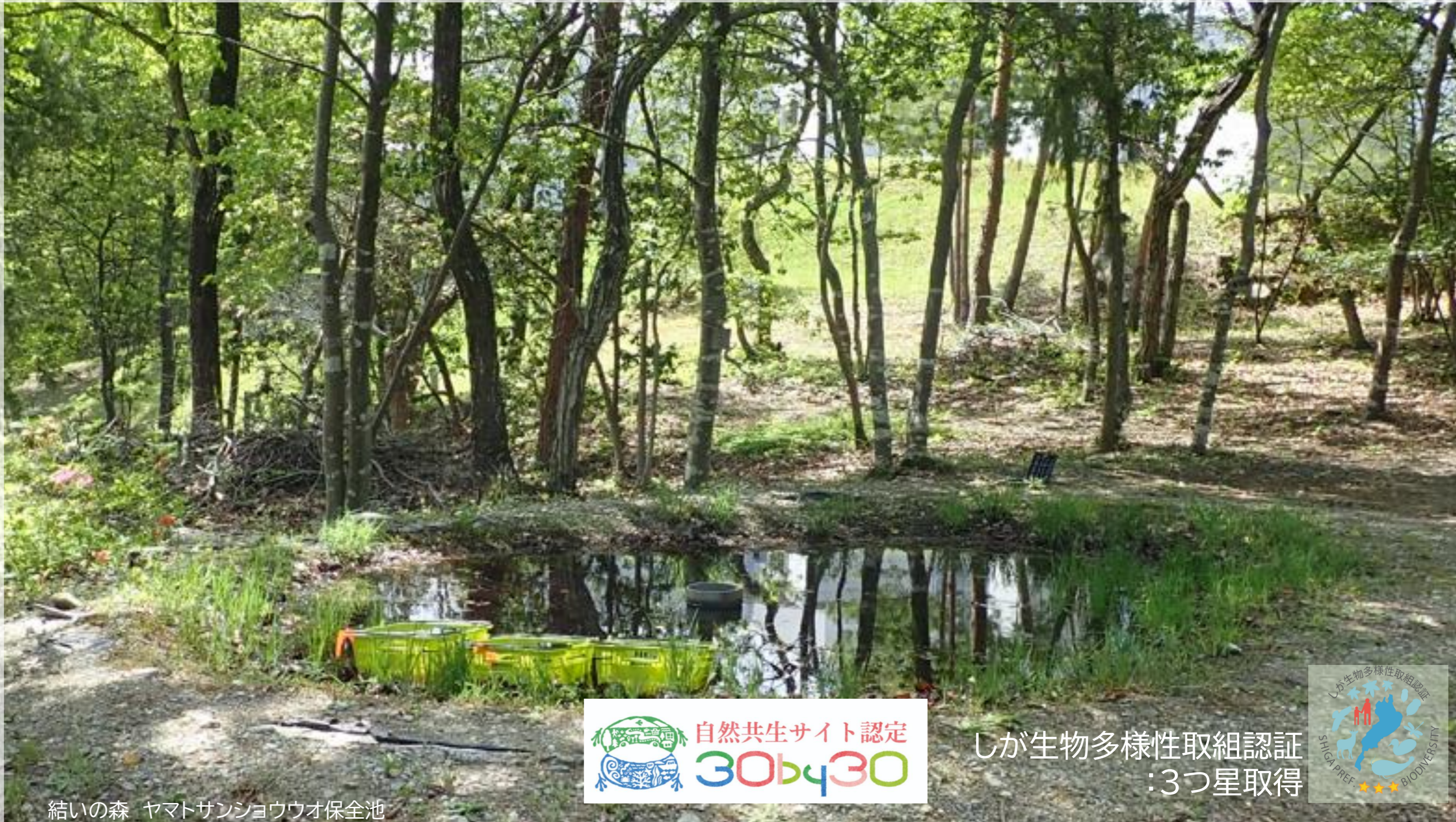
結いの森 ヤマトサンショウウオ保全池