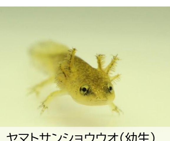
ヤマトサンショウウオ(幼生)