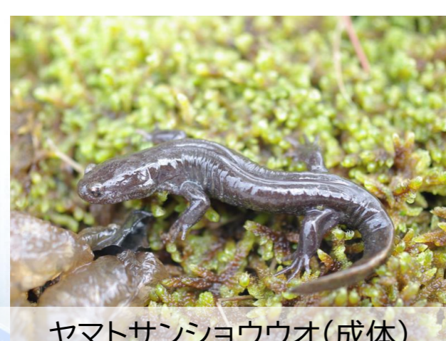
ヤマトサンショウウオ(成体)