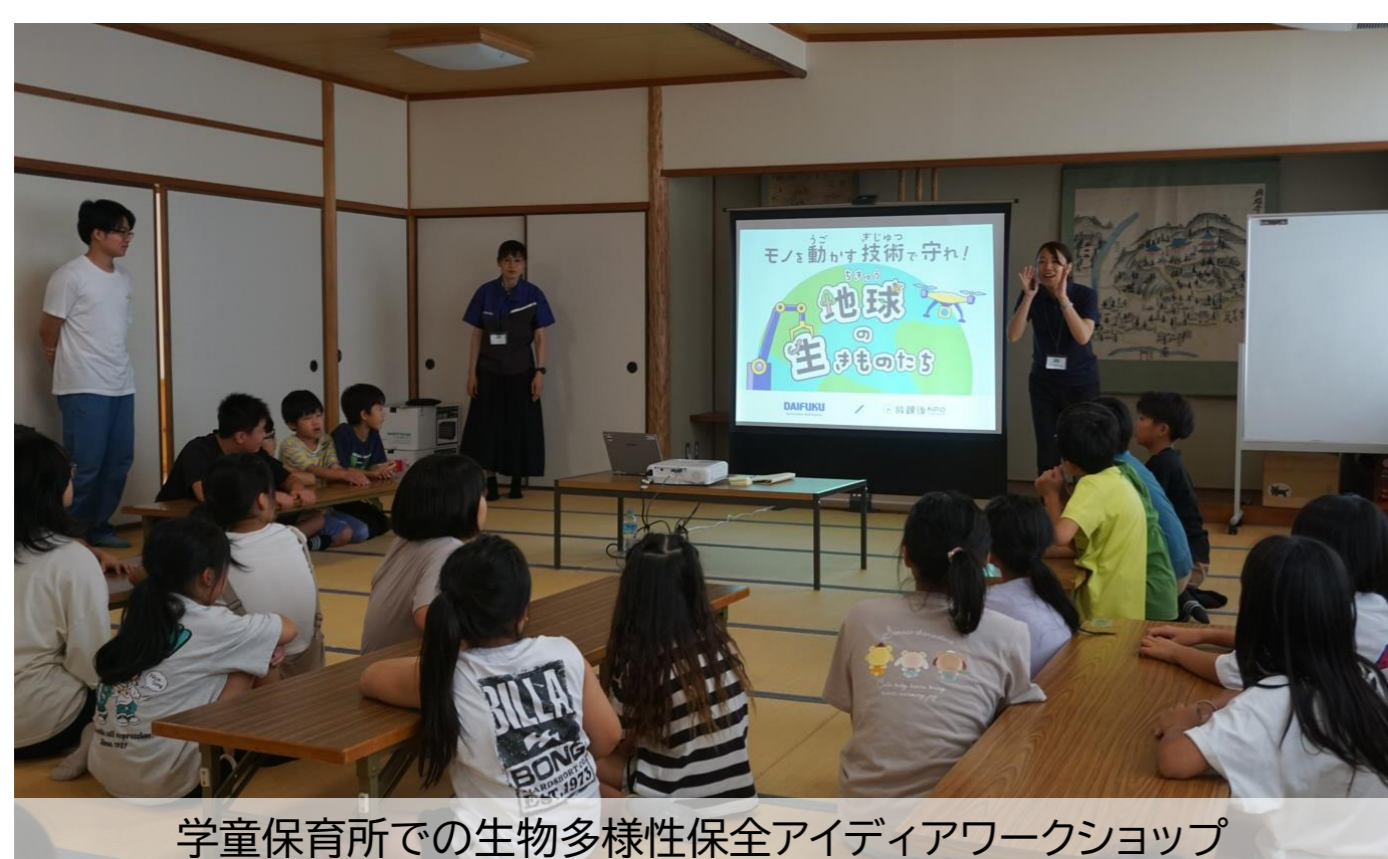
学童保育所での生物多様性保全アイデアワークショップ