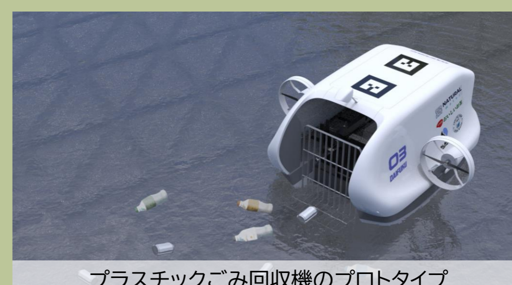
プラスチックごみ回収機のプロトタイプ