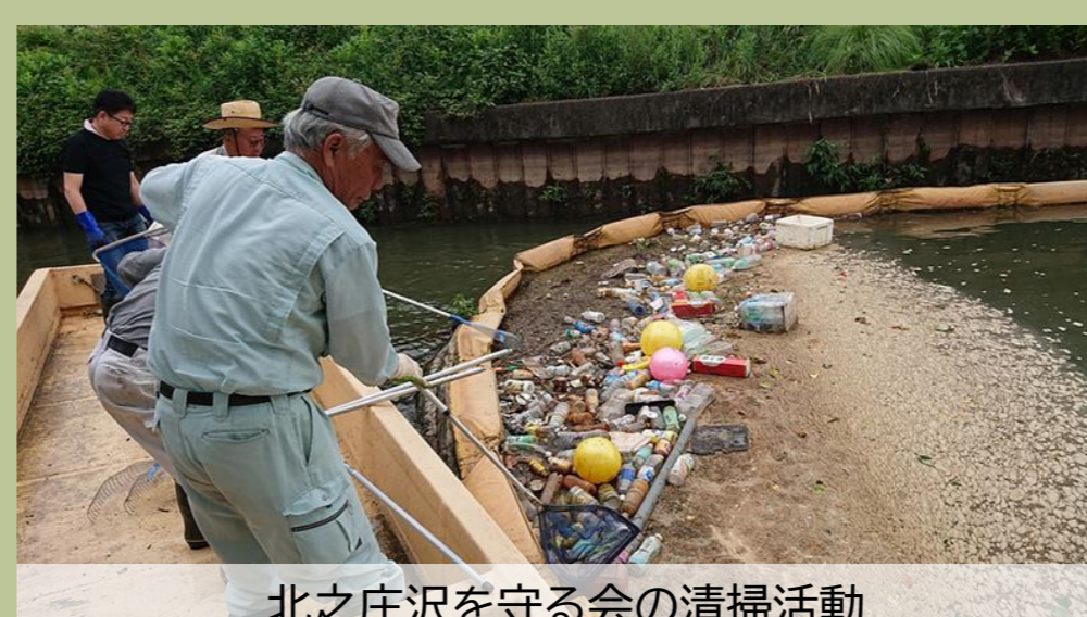
北之庄沢を守る会の清掃活動

滋賀県近江八幡市の「北之庄沢を守る会」と連携し、河川に漂流するプラスチックごみの回収や調査を行っています。地域と協働し、ダイフクの技術を活かして、河川環境の保全とごみ削減に取り組んでいます。