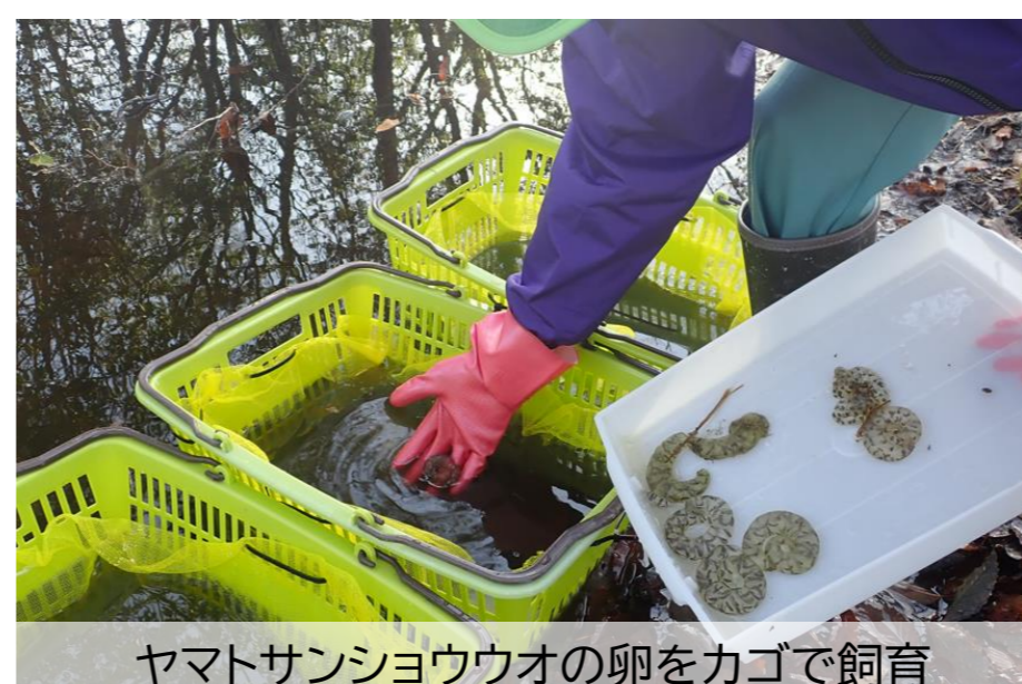
ヤマトサンショウウオの卵をカゴで飼育

「結いの森」は、事業所内の自然資本を活かし、自然と共生する場です。保全池では希少種ヤマトサンショウウオの保護・増殖に取り組んでいます。従業員とその家族向けの自然観察会では植栽を行い、県内小学校の環境学習にも活用することで、学びと交流の場を提供しています。さらに、間伐材をポストカードや樹木プレートに再利用したり、チップ化して遊歩道に敷設するなど、資源循環を推進しています。