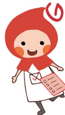
「滋賀県健康づくりキャラクター クミ」